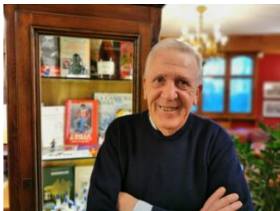
L'autore – Gustavo Vitali